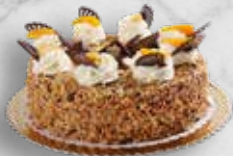
TVAROHOVÝ DORT S MERUŇKAMI