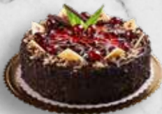
VIŠŇOVÝ DORT SCHWARZWALD