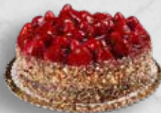
JAHODOVÝ NEBO MALINOVÝ DORT