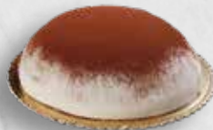
MARCIPÁNOVÝ DORT ČOKOLÁDOVÝ MOUSSE