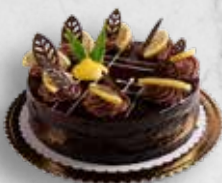
TVAROHOVÝ DORT ČOKO-CITRON