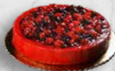
TVAROHOVÝ DORT - CHEESE CAKE S MALINAMI NEBO LESNÍM OVOCEM